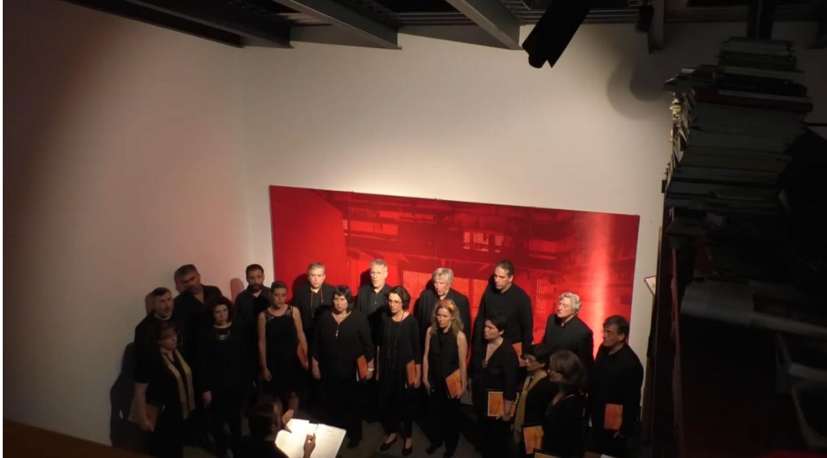
Figura 3. (2018) Concierto del coro Nur en el estudio. [Fotograma de vídeo]. Recuperado de NI DECIR CASA BOLA , link: youtube.com/watch?v=cvZon1kb7AQ

https://dx.doi.org/10.48260/ralf.extra2.52