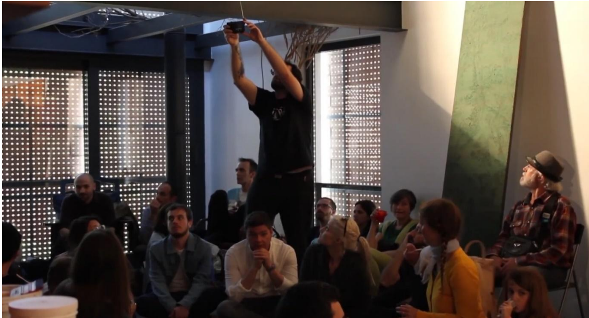
Figura 1. (2017) Final de la actuación del colectivo maDam en el estudio. [Fotograma de vídeo]. Recuperado de DOING NOTHING CASA BOLA , link: youtube.com/watch?v=ArgefUZpe9E

https://dx.doi.org/10.48260/ralf.extra2.52