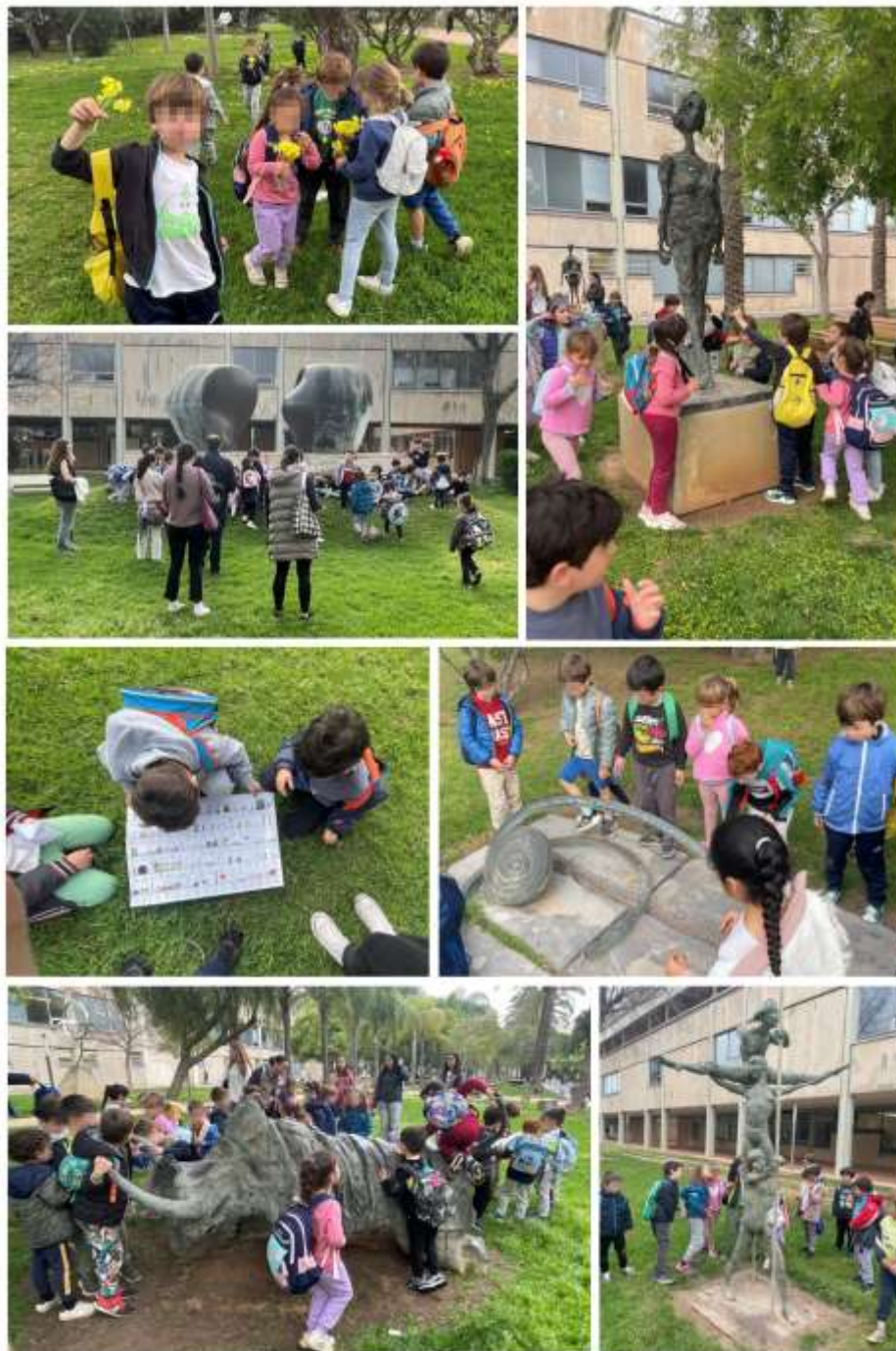
Figura 3. Fotoensayo Paseando por el campus escultórico de la Universitat Politècnica de València con niños y niñas de cinco años y alumnado del Grado en magisterio en Educación Infantil .

https://dx.doi.org/10.48260/ralf.extra5.217