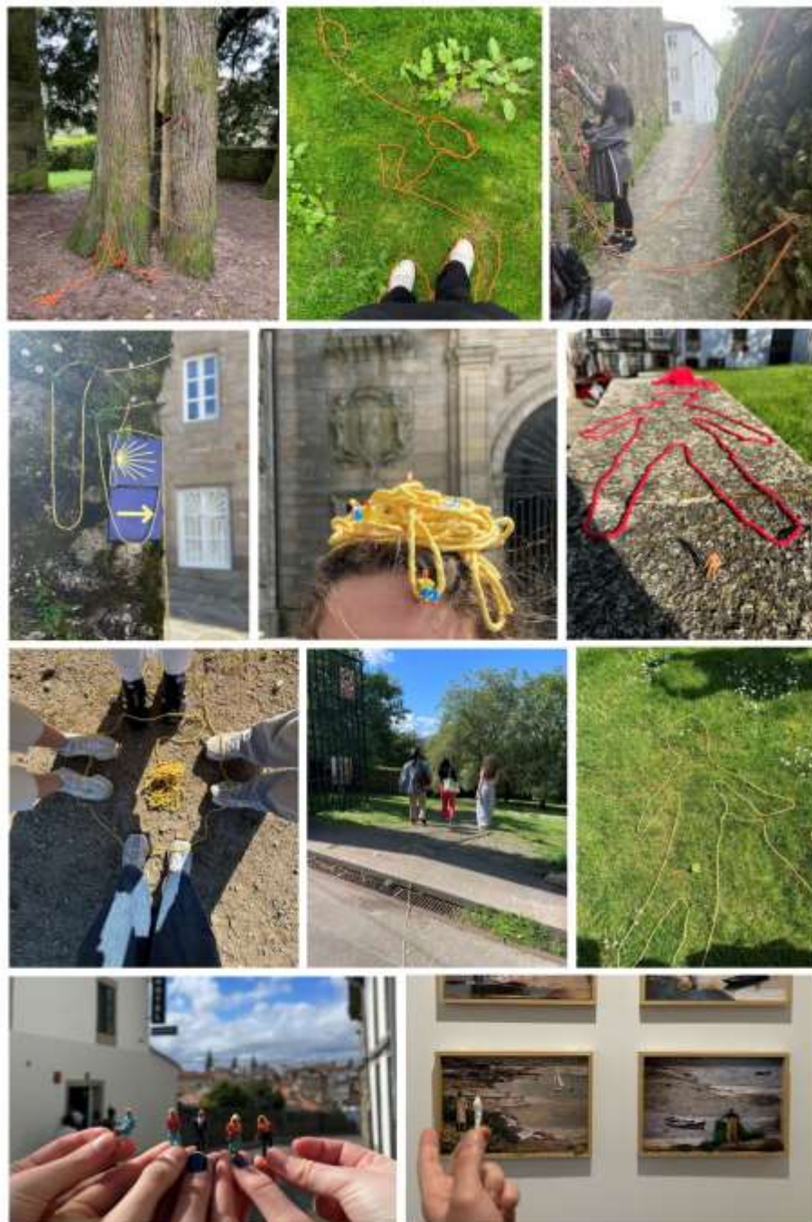
Figura 4. Fotoensayo Paseando desde la Facultad de Ciencias de la Educación hasta el Museo do Pobo Galego, atravesando el Parque de Bonaval .

https://dx.doi.org/10.48260/ralf.extra5.217